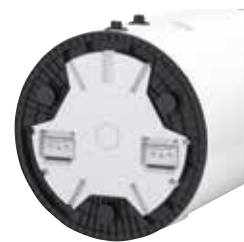
Integroidut kantokahvat helpottavat käyttövesivaraajan liikuttelua.