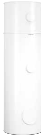
Vitocell 100-E 75 l + Vitocell 100-V 300 l